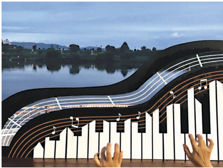
스마트폰사진 부문대상_사문진의 노래_이재웅

스마트폰사진 부문의 대상(상금 100만원)에는 ‘사문진의 노래’(출품 이재웅)가 선정됐다. 작품은 사문진 나루터의 피아노 모양 설치물을 배경으로 실제 피아노를 연주하는 듯 흥내를 내는 손의 모습을 담아 표현력과 창의성