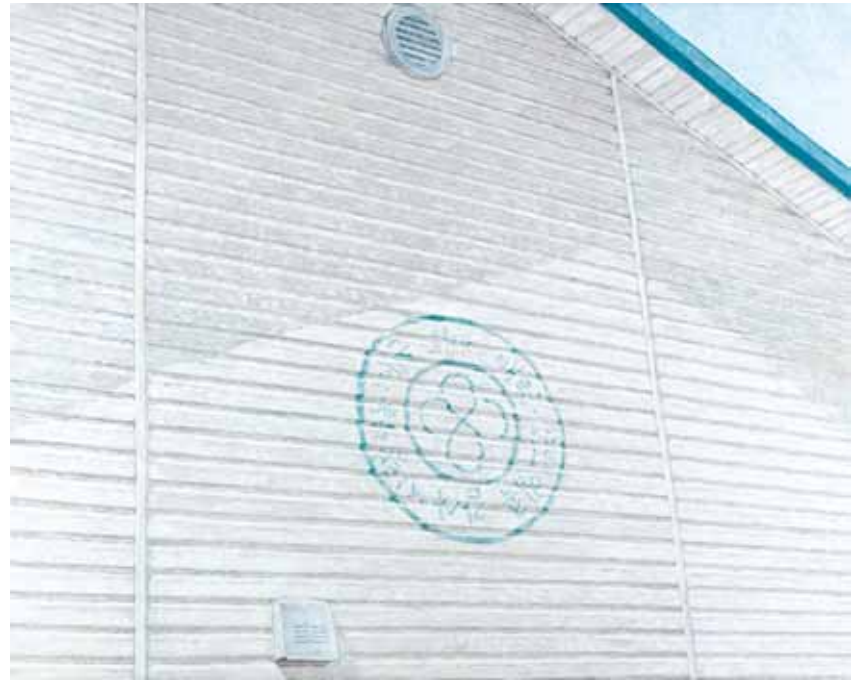
장동욱_2024 Spring, Oil on canvas, 130x160cm

보의 물길을 따라 주변에서 포착할 수 있는 풍경을 프로젝트 주제로 정해 작가만의 특징이 담긴 색감과 형태를 더해 회화 작업으로 표현했다.