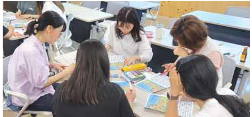
이 방법을 배우는 강좌가 있어 바로 적극 활용하고 싶다."라고 말했다. 신청했다. 열심히 해서 배운 내용을

프로그램에 참가한 한 학부모는 "도서관에서 하는 수업을 듣다가 책놀이 활동에 관심이 생겼는데 책놀