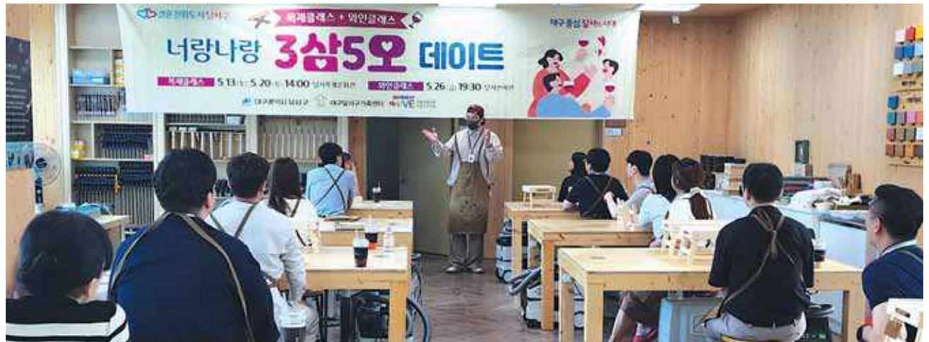
3삼5오(목재) 데이트 만남행사(2023. 5.13.)

행사는 MBTI 검사를 사전 진행한 참가자들과 오리엔테이션을 시작으로 1:1 로네이션 대화, 연애토크, 팀별 레크리에이션 등을 통해 서로를 알아가고, 두 번째 만남에는 킥볼 레크리에이션과 체력프로그램 등을 통해 초강이 쌓인 이성에게 바