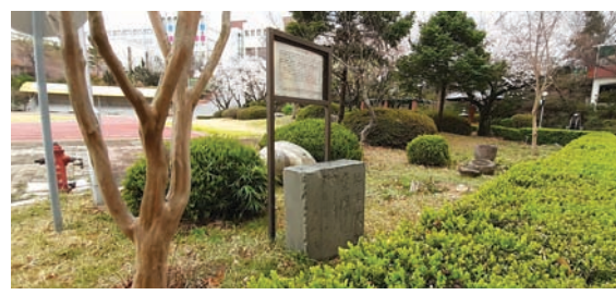
원화여고 운영 척화비