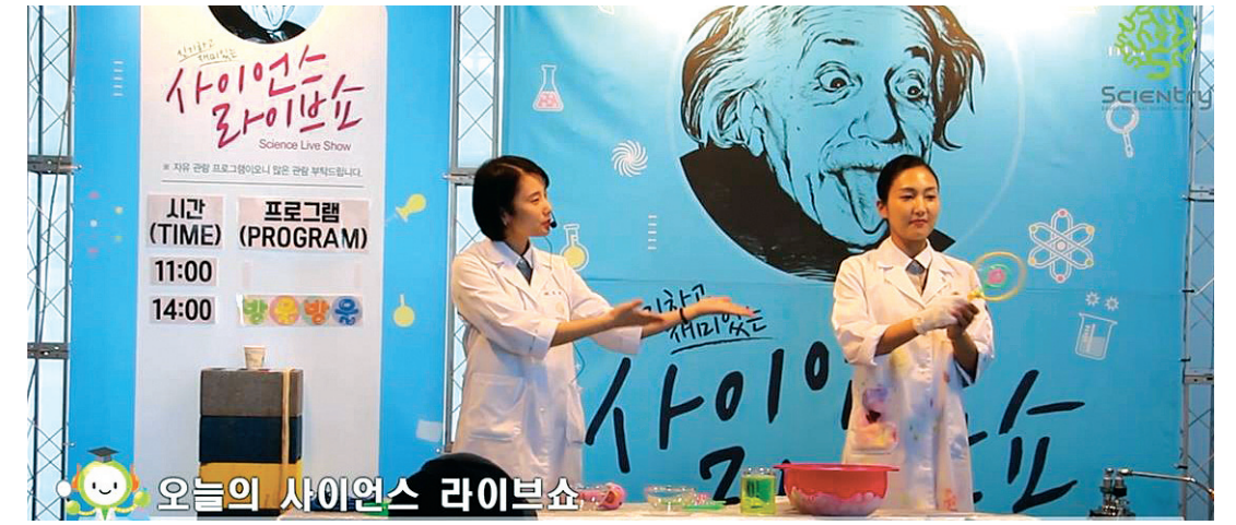
과학관 ON AIR 주요 콘텐츠 영상(전시·사이언스 라이브쇼)

'전시물 해설'에서는 과학관의 대표전시품 '생동하는 지구, S.O.S', '라이프 코스터' 등 주요 전시품에 대하여 온라인 심층해설을 제공하며, '과학 엔터테인먼트'에서는 과학관 현장에서 운영하는 주요 프로그램인 '사이언스 라이브쇼', '사이언스 카트' 등 인기 퍼포먼스 콘텐츠를 온라인으로 체험한다. 또 '과학특강'에서는 과학관 소속 연구원(박사급 전문가 및 교육강사 등)이 첨단과학과 기초과학을 아우르는 다양하고 흥미로운 과학관련 주제를 재미있