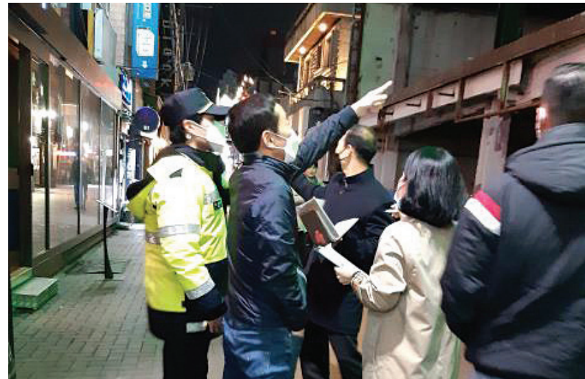
사회적 거리두기 이행 여부 점검 사진

위해 현재까지 민·관·군이 협업체를 통해 확진자 발생 관련시설과 공공시설, 대중교통, 복지시설, 교육시설, 전통시장 등 유통시설에 대한 방역소독을 광범위하게 실시하고, 취약시설에 대해서는 방역약품과 소독장비를 배부해 자체적인 코로나19