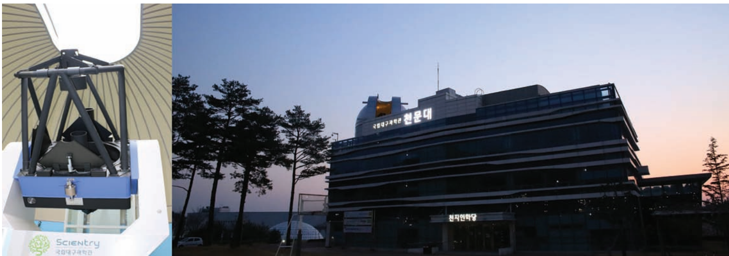
국립대구과학관 1m 주망원경(좌)과 천문대 건물 전경(우). 국립대구과학관 천문대는 전시관이 있는 본관으로부터 별도로 있는 교육동인 천지인학당에 있다.

천문대 개관에 맞춰 천문교사연수, 1m 망원경을 활용한 실습교육 등 보다 깊이 있는 교육도 새롭게 만날 수 있