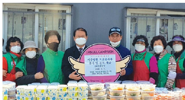
제2미주병원 의료종사자 식사 제공

달성군과 담양군의 인연은 지난 1983년 8월 자매결연을 맺으면서 시작되었다. 이후 군민의 날 행사 및 군민체육대회 참석, 공무원 교환근무, 청소년 역사탐방 등을 함께 진행하며 매년 번갈아 방문했다. 특히 지난 2003년부터 담양군은 달성의 대표 축제인 비슬산참꽃문화제에 매년 방문해 자리를 빛내주는 등 동서화합을 추구하며 상생을 모토로 교류해오고 있다.