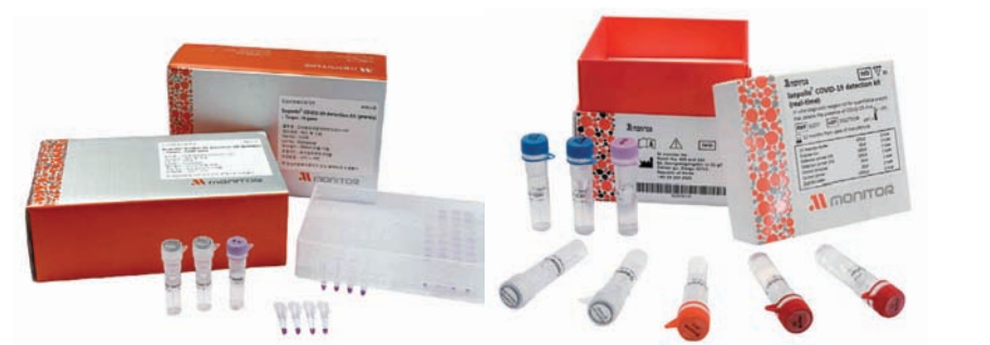
Isopollo COVID-19 detection kit (premix)